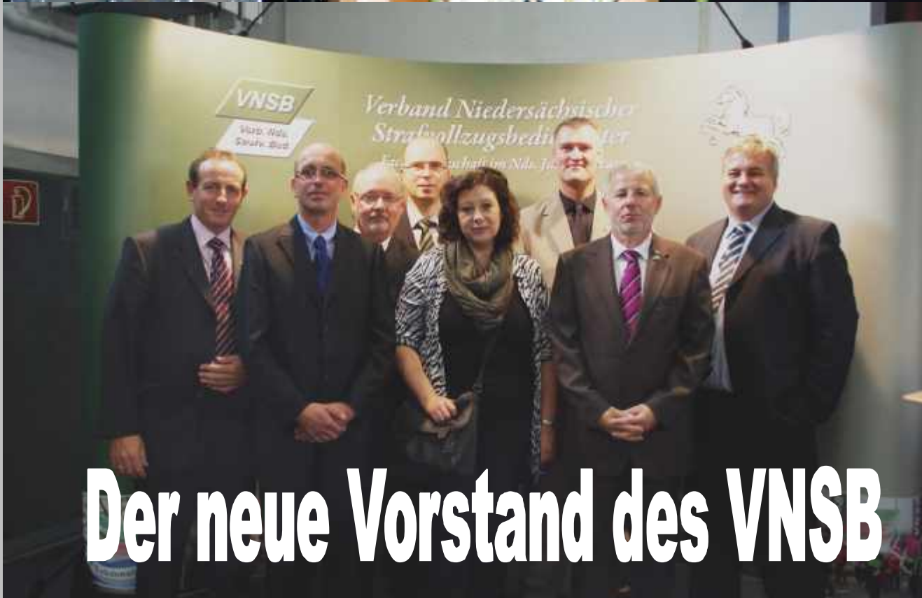
Der neue Vorstand des VNSB