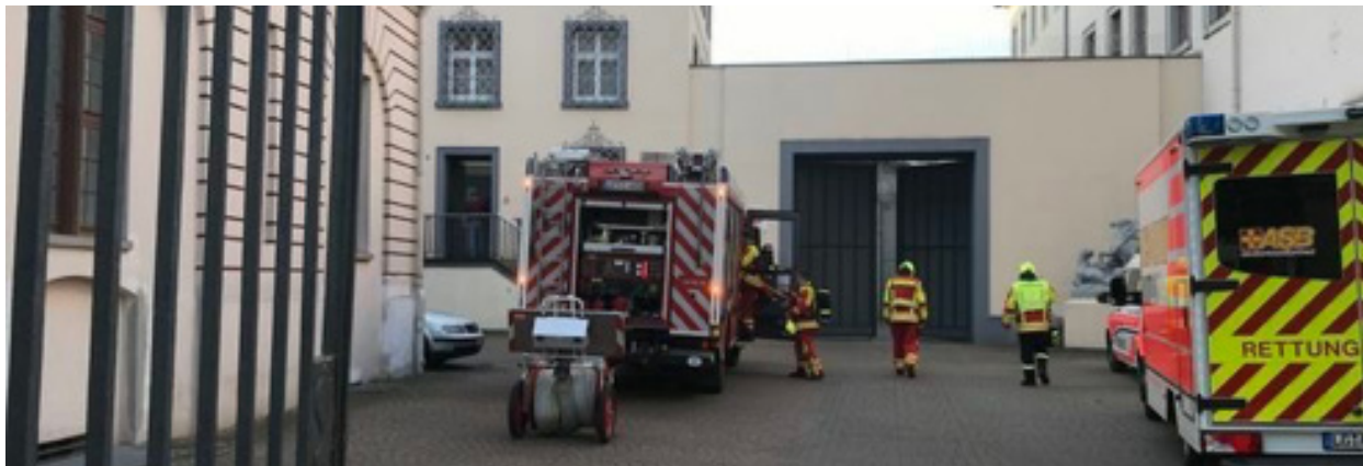
Die Feuerwehr musste am Freitagabend in der JVA am Markt ein Feuer löschen, das ein Häftling gelegt hatte.

Ein Häftling hat am Freitagabend (8. Mai 2020) in seiner Zelle in der JVA Uelzen, Abt. Lüneburg am Markt ein Feuer gelegt und erlitt dabei wahrscheinlich eine Rauchvergiftung. Der Einsatz lief kurz nach 19:00 Uhr in der Leitstelle der Feuerwehr auf: „Unklare Rauchentwicklung in der Justizvollzugsanstalt.“ Nach Auskunft von Feuerwehrsprecher D. Roemer hatten die Justizvollzugsbeamten das Feuer weitgehend selber erstickt. Allerdings zog