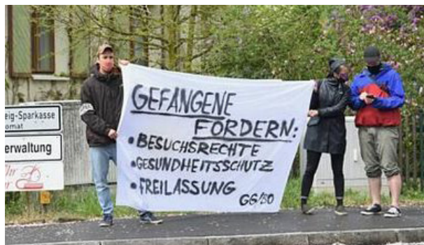
Demonstranten vor der Justizvollzugsanstalt in Untermaßfeld