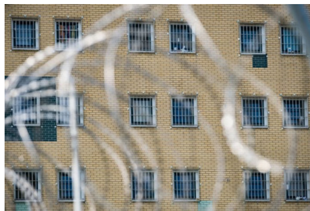
Justizvollzugsanstalt in Hannover