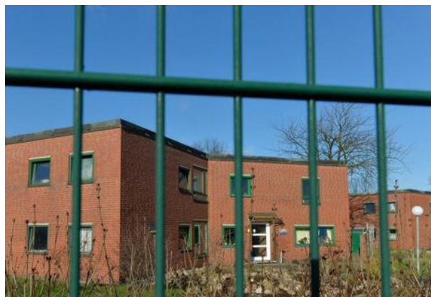
In der Justizvollzugsanstalt Oslebshausen gibt es erste Corona-Fälle.

werden daher ab morgen alle Beschäftigten und Gefangenen der Offenen Vollzugsabteilung getestet – die Ergebnisse erwarten wir am Wochenende“, sagte Tschöpe. Davon betroffen seien insgesamt 40 Mitarbeiter und 47 Gefangene.