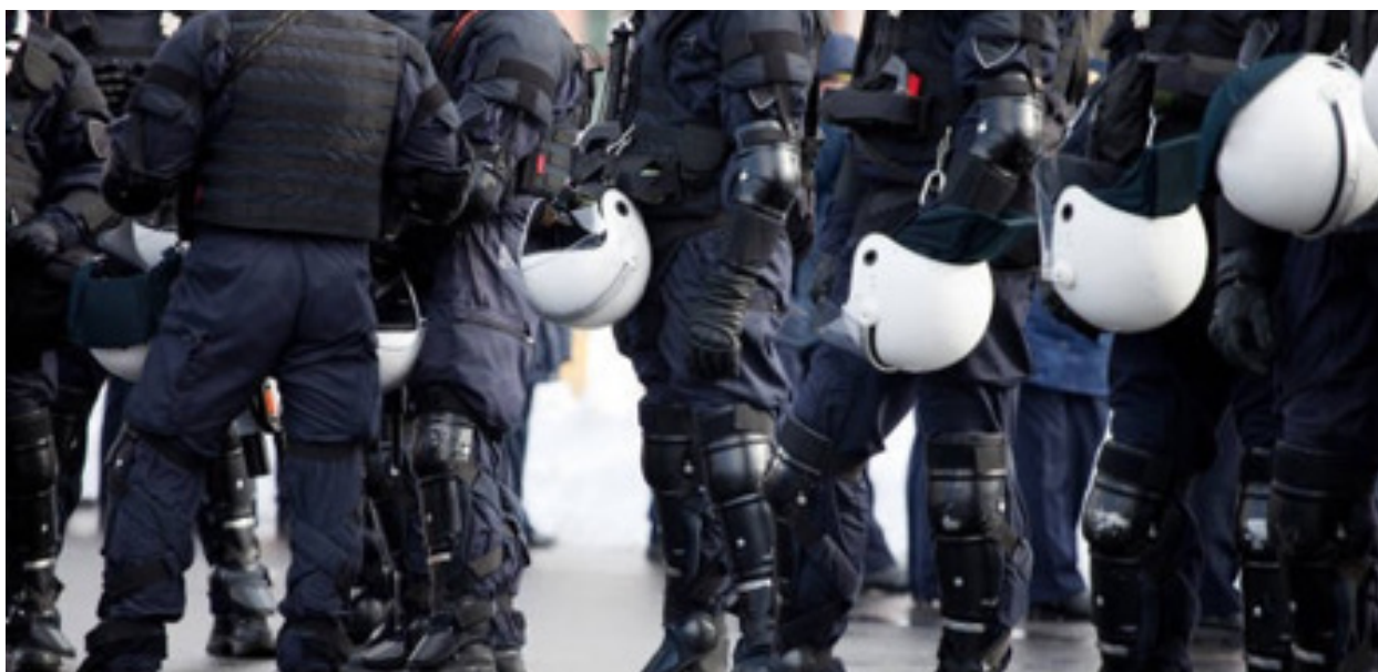
Generalverdacht und Beweislastumkehr: Sieht so das Vertrauen eines Dienstherrn aus?

Wenn man das Landes-Antidiskriminierungsgesetz (LADG) zur Kenntnis nimmt, drängt sich dieser Eindruck unzweifelhaft auf. Berlins grüner Justizsenator Dirk Behrendt ist mächtig stolz darauf, dieses in Deutschland bislang einmalige Gesetz gegen viel Gegenwind und Widerstände durchgesetzt zu haben. Nach mehr als einjähriger Diskussion hat das Berliner Abgeordnetenhaus das von Behrendt vorgelegte Gesetz am 4. Juni 2020 verabschiedet.